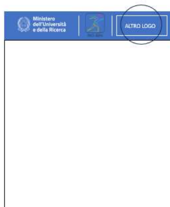
VERSIONE CON I DUE LOGHI ISTITUZIONALI E UN SOLO LOGO ENTE (SI POSIZIONA IN ALTO DIVISO DA LINEA BIANCA)