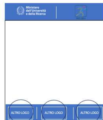
VERSIONE CON I DUE LOGHI ISTITUZIONALI E PIU' LOGHI ENTE (SI POSIZIONA IN BASSO DIVISI DA LINEA BIANCA)

ALLEGATI FILE INDESIGN + PDF + DOCUMENTO WORD